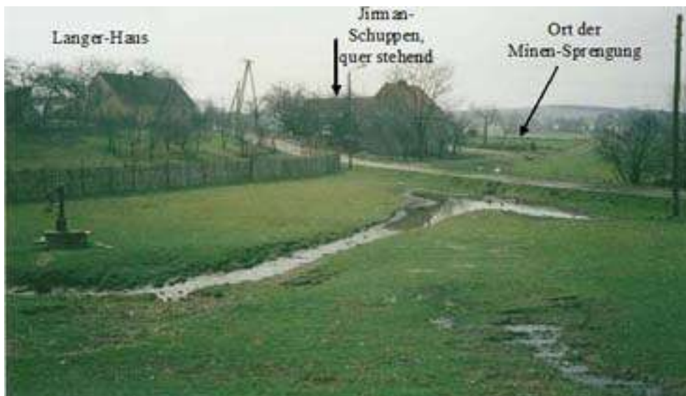
Bild 10: Felder, Wiesen, Bäche und Teiche - eine Idylle im Zentrum von Hussinetz: Im 2. Weltkrieg und im „ Minenkrieg “ danach wandelte sich der Charakter der geliebten Heimat Erde allerdings zeitweise dramatisch.