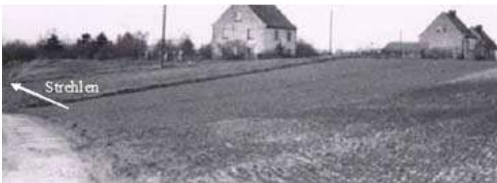
Bild 14: Etwa an dieser Stelle auf dem Weg nach Strehlen überraschte uns die Tellerminen-Sprengung.

Hierzu zwei Zwischenberichte: Ich bekam ja mit meinem Bruder noch viel deutlichere Abschreckungs-Signale, weil mehrere Splitter-Geschosse nach uns zielten. So wurden wir schon in der Zeit der Minensprengungen bei einem gemeinsamen Gang nach Strehlen auf's Korn genommen, Bild 14. Soeben öffnete sich die Weite der Stadt vor uns im Tal, als die Luft von einer gigantischen Explosion erschüttert wurde. Die Zündung fand wohl - für uns ohne Vorwarnung - im alten Steinbruch (1861 angelegt) in gut 300 m Entfernung statt. Trotzdem fauchte jaulend ein ziemlich großer Stahlsplitter knapp über unsere Köpfe hinweg, um sich gleich nebenan ins Feld zu bohren. Wir haben dann sofort nach ihm gesucht und wurden auch fündig. Schönen Gruß von den Tellerminen! Man war zwar furchtbar erschrocken, doch es herrschte schnell verständnisvolle Klarheit. Es musste halt sein, dass dieses Teufelszeug vernichtet wird!