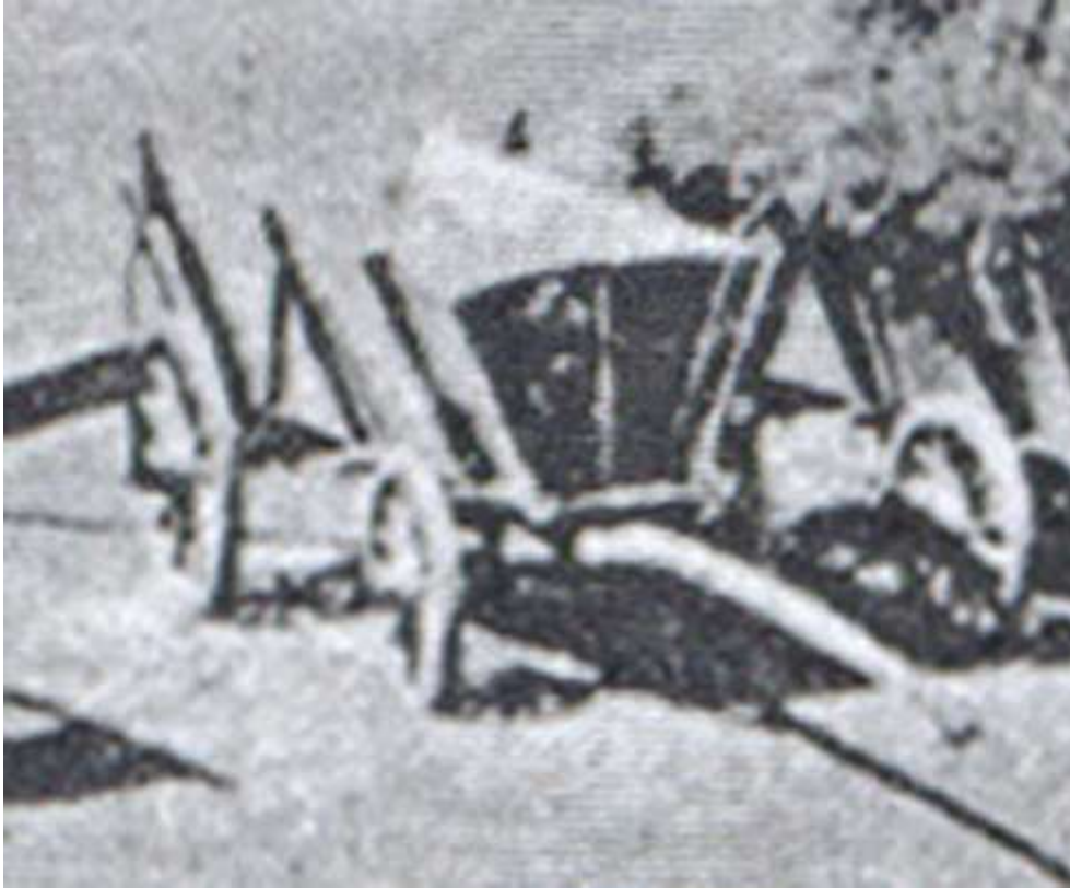
Bild 4: Ein solcher Pferdewagen brachte uns Ahnungslose in die ersehnte Heimat zurück.