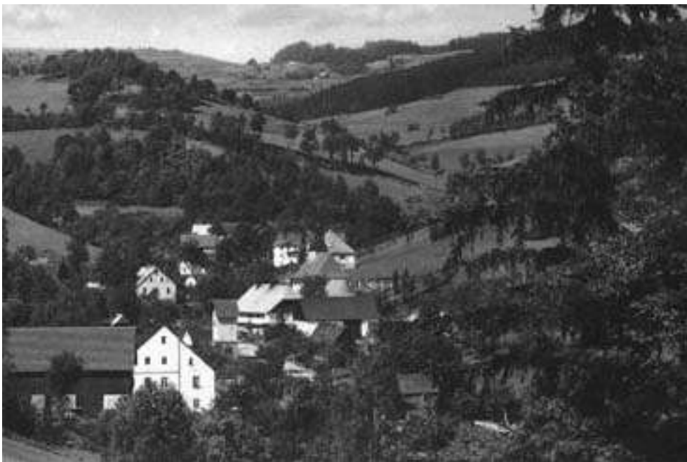
Bild 1: Für die Anmutigkeit der Neuweistritzer Landschaft dürften die Soldaten damals kaum einen Sinn gehabt haben. Der steile Anstieg forderte von ihnen jedoch den äußersten Tribut.

Und die tatsächlichen Ereignisse waren denn auch für mich Friedrichsteiner Knäblein im fremden Neuweistritz so dramatisch, dass ich in der Rückbesinnung nicht einmal einschätzen kann, ob ihr erster Teil viel mehr als nur 24 Stunden lang andauerte. Doch dieser hohen Ablaufgeschwindigkeit verdanken wir Evakuierten wohl andererseits unser weiteres Leben, denn der Tod hatte keine Zeit für wahllosen Zugriff. Er konnte sich nur auf Einzelne, Unglückliche konzentrieren. Jedenfalls entwickelte sich an einem hellerlichten Tage aus dem lang gezogenen Tal heraus eine schier endlose, bizarre Schlange heillos flüchtender deutscher Truppen. Es war wie im Theater, und man saß in der ersten Reihe. Die gehetzten Soldaten und ihr Tross warfen zudem in ihrer Hektik vor unseren Augen fast alles weg, was auch nur annähernd die Kategorie Ballast erfüllte. Es ging ja hier so endlos steil bergauf, siehe Bild 1! Doch hinter dem Bergmassiv, in Böhmen, bei den Amerikanern, glaubte man, Rettung zu finden. Es ist übrigens nicht ausgeschlossen, dass auch unser Papa bei dieser Gelegenheit unerkant an uns vorbei gezogen ist, denn auch er wurde mit seinem Armeeverband kurze Zeit später in Böhmen gefangen genommen.