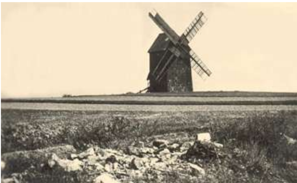
Bild 9: Die Hussinetzer Windmühle war ein seltenes Ereignis in Schlesien, doch auch sie wurde ein Kriegsopfer.

Oben auf dem Windmühlenberg, also in östlicher Richtung, vermisste ich nach dem Krieg die charakteristische Windmühle (Bild 9). Nach Alfred Kilian sei sie erst in den letzten Kriegstagen zerstört worden. Da kann man sich lebhaft vorstellen, dass nur noch ein großer Aschehaufen den totalen Untergang des stolzen hölzernen Wahrzeichens markierte, das es seit langem nicht nur für unsere Gemeinde, sondern auch für Strehlen darstellte. Für die Russen müsse es ein lohnendes Ziel gewesen sein (weil deutsche Soldaten vermutlich von dort aus nach ihnen Ausschau hielten), glaubte ich für lange Zeit. Doch sollen die Deutschen dieses Riesenfeuer gelegt haben, wurde ich später eines Besseren belehrt.