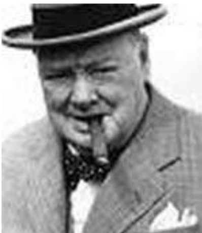
Bild 3: Den Wert der Zigarre präsentierte wohl niemand nachhaltiger als Hitlers Gegenspieler Winston Churchill.