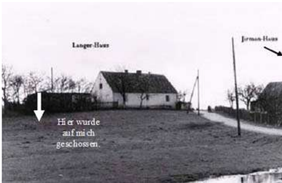
Bild 12: Im Nachkriegs-Hussinetz war man nirgends mehr absolut sicher, denn überall lauerten Gefahren - vor allem für Kleinkinder - seien es scharfe Sprengladungen, auffällige Ruinen oder sogar vereinzelt Menschen, die einem nach Leib und Gut trachteten.

Ja, der Junge sah äußerlich völlig verändert aus und hatte radikal die Farben gewechselt. Die Blutleere im Gesicht wurde freilich überdeckt, denn reichlich Russ und Tränen sorgten für Strukturen, die bisher selten in Hussinetz gesehen worden sind. Sie erinnerten wohl eher an Indianer- oder Räuber-Animationen. Mama musste den kleinen Kerl voller Entsetzen ganz fest an sich drücken. Es kann sogar sein, dass ich dort für´s Leben den Umgang mit offenem Feuer und damit auch jegliche Raucherabsichten aufgegeben habe. Seither wurden weitere ähnliche Ereignisse im Umfeld des Kindes tief in das Gedächtnis eingegraben. Zum Glück kam keines mehr so brisant daher und in so große, persönliche Körpernähe. Oder doch?