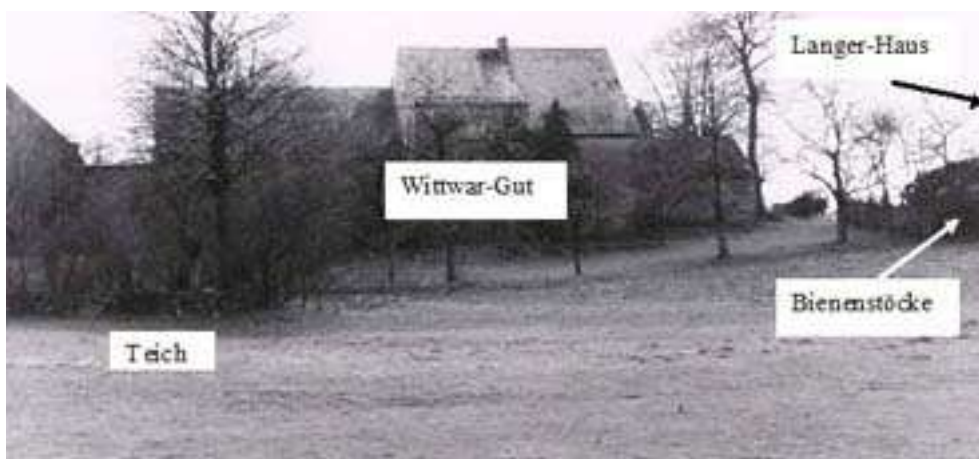
Bild 6: Dies war mein bevorzugtes Spielfeld im Nahbereich mit guter Deckung von zu Hause aus. Der Teich und unsere Bienenstöcke markieren zudem einen mittleren Abstand der Gefahrenquellen im Nachkriegshussnetz: Der Friedenspfad der theoretischen Sorglosigkeit war als oft kürzer als 100 m.