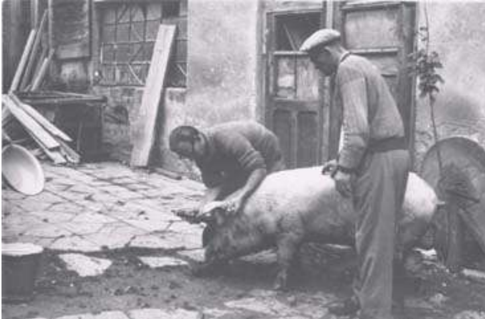
Bild 13: Etwa an gleicher Stelle im Tscherny-Hof wurde seinerzeit das verunglückte Pferd notgeschlachtet.

Insofern kommen wir an dem Panzergranaten-Blindgänger nicht vorbei, den ich irgendwo im Gartengelände des Wittwar-Gutes fand. Er war dort nach Einschätzung des Knirpses fehl am Platze, also umklammerte er das schwere Gerät mit beiden Armen und schaffte es zu Nachbar's Teich, der sich neben dem damals gemeinsam genutzten Trinkwasser-Brunnen befindet. Auf diesem Teich wurde später öfters „ Schiffchen gespielt “. Ja, diese prächtige Kogge, die mir mein Vater - er wollte ja einst Tischler werden - in besseren Zeiten gebaut hatte, zog hier bis zu unserer Vertreibung ihre Kreise. (Ich musste seinerzeit das geliebte Schiff zugunsten meiner Briefmarkensammlung schweren Herzens zurück lassen.) Die scharfe Granate wurde dann am westlichen Rand des Weihers ins Wasser gelassen. Dort rollte sie langsam fort, bis sie in den Tiefen des stillen Wassers den kindlichen Blicken entschwand. Der blanke Zünder zeigte eindeutig nach links! Und dies alles schreibe ich mahnend für die Nachwelt auf, denn ich habe das Areal im Jahr 2004 wieder aufgesucht. Der verwahrloste Brunnen funktionierte noch und weckte Erinnerungen, die ich zu Papier gebracht habe. Auch der verschlammte Teich, siehe Bild 6, zeichnete sich im Dickicht deutlich und fast kreisrund ab, kaum 60 cm tief ... allerdings jetzt trocken und begehbar. O weh, denn das Satansding liegt dort bestimmt noch mitten im Schlamm!!!