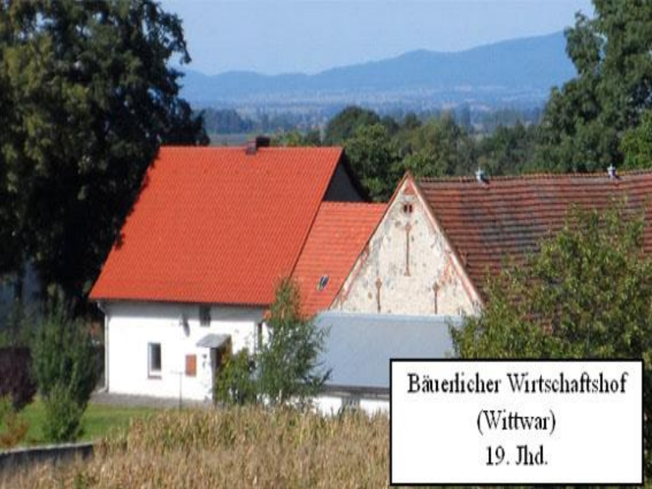
Bäuerlicher Wirtschaftshof (Wittwar) 19. Jhd.