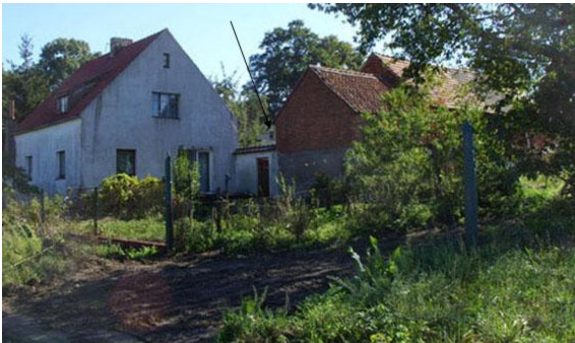
Bild 1: Das Einfamilienhaus mit Nebengebäuden (erbaut von der Familie Jirman 1937/38), aufgenommen im Jahr 2012 mit Blick von den Wiesen, befindet sich in einem guten, sanierten Zustand. (Der Pfeil zeigt auf ein Fenster des im Hintergrund auf einer Anhöhe befindlichen Nachbarhauses, ehemals Familie Fleger/Langer.)

Ihr Wohnhaus, Bild 1, baute sich die Familie Jirman in den Jahren 1937/38 direkt bei uns gegenüber an der Kauba-Reihe, Nr. 251, siehe Lageplan-Entwurf in Bild 2, und wurde so unser Nachbar.