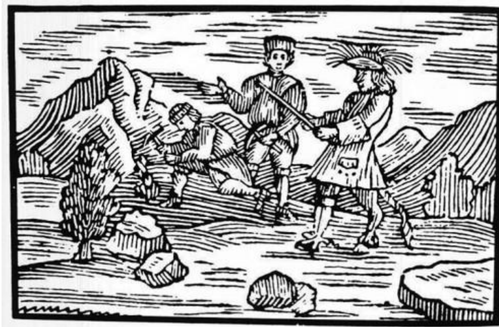
Bild 9: Schlesische Bergbauszene mit dem Rübezahl (mit der Wünschelrute), Holzschnitt von Lindner, 1580

Ich suchte mir dazu als Motiv einen der charakteristischen Schätze aus, die man in sehr alten Zeiten - wohl mit der Wünschelrute des Rübezahl - tatsächlich in der schlesischen Erde fand: Gold, siehe Bild 9!